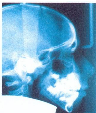
Morso aperto o profondo